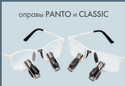
оправы PANTO и CLASSIC

Встроенные линзы с диоптрийной коррекцией.